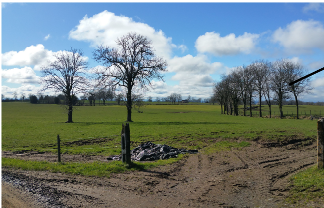
Site archéologique et larges vues depuis la RD.