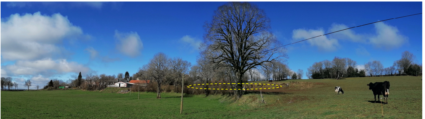
Zone d'implantation du futur bâtiment à l'arrière de la ligne arborée

Pour s'adapter au terrain, les parcelles sont délimitées par des murets ou talus. Il est préconisé de disposer le futur bâtiment contre le talus, pour une intégration optimale dans le relief et ainsi le protéger des vents du Nord.