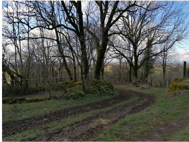
Secteur accidenté et difficile d'accès