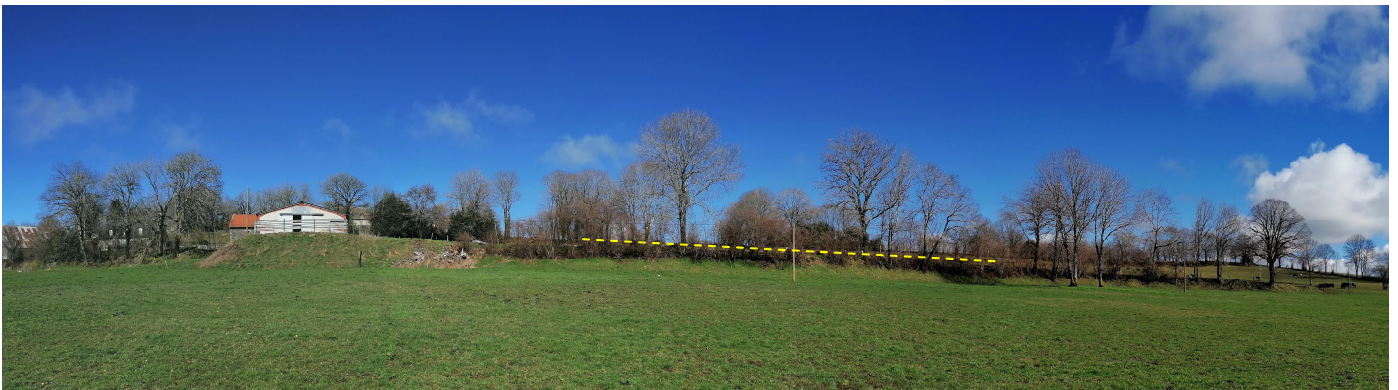
Zone d'implantation vue au travers des arbres depuis la prairie humide